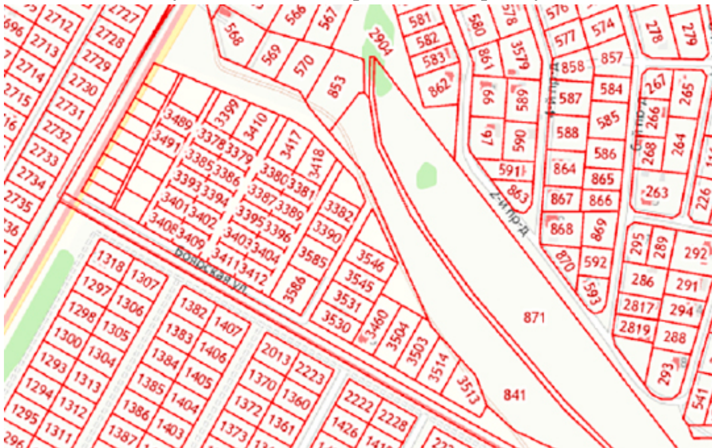
Схема элементов улично-дорожной сети в поселке Торхово муниципального образования город Тула

Решение Тульской городской Думы от 20 декабря 2023 года № 56/1248